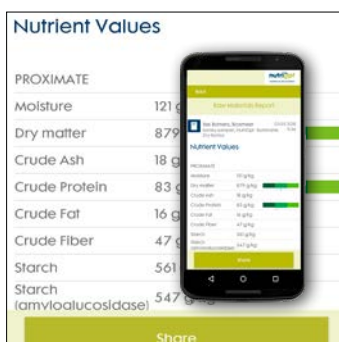
9. Contoleer de voerwaarden