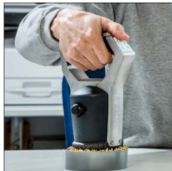
6. Druk op 'Scan'