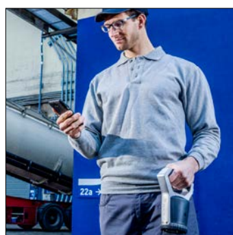
10. Pas uw voermanagement aan