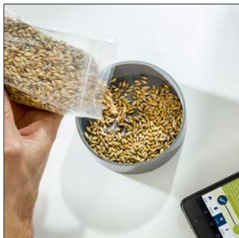
5. Vul een bakje met voer