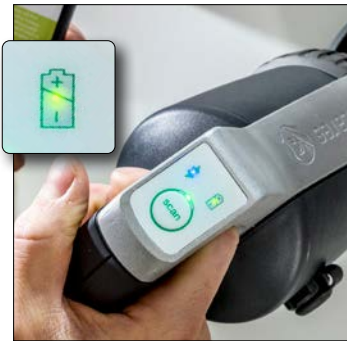
1. Laad batterij op