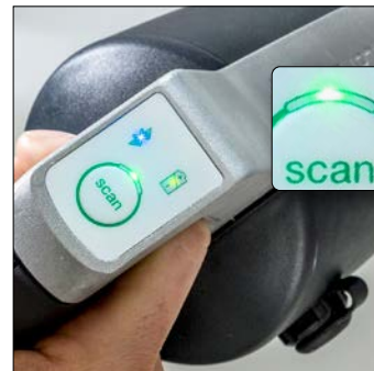
7. Wacht totdat de scan klaar is