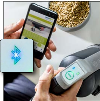
3. Koppel de scanner en smartphone via Bluetooth