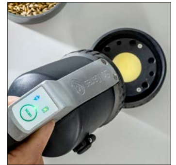
4. Kalibreer de scanner